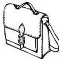
PENCIL – NOTEBOOK – BOOK – SCHOOLBAG